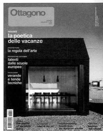
Shingle House, Dungeness, Kent, NORD Architecture